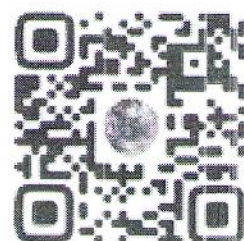
Информация для кандидата