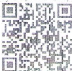
Денежное доволствоие военнотружущих по контракту